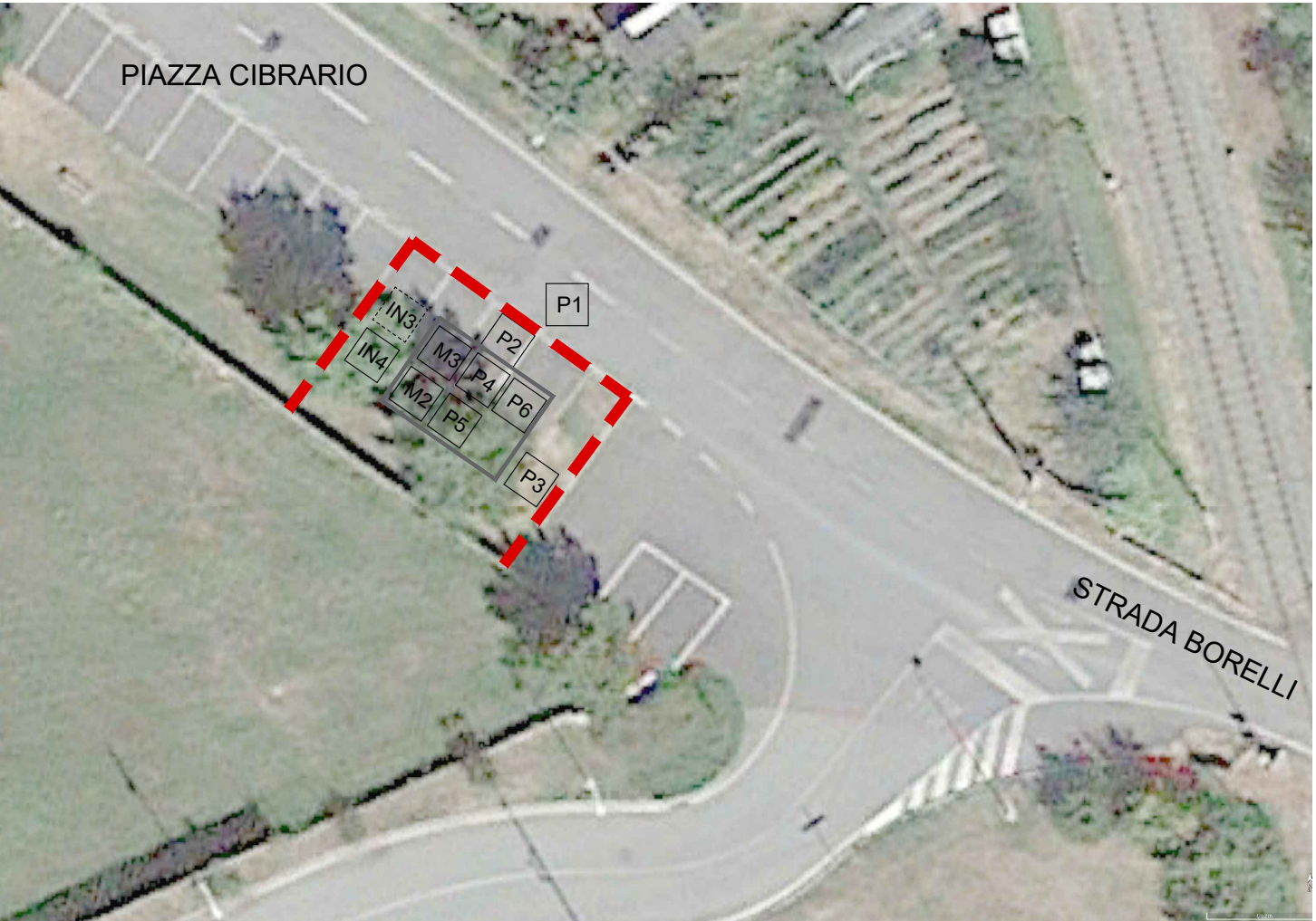
PIAZZA CIBRARIO - SERVIZI LOGISTICI